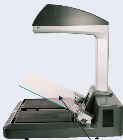
Samootevírací zabudované sklo (pro modely CopiBook RGB+ a BW+)